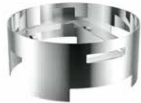
Höhe inklusive Chafing Dish 30 cm height inclusive Chafing Dish 11 3/4 inch

BUFFETGESTELL RUND INDUCTION PLUS Buffet stand round INDUCTION PLUS / Support buffet rond INDUCTION PLUS / Soporte para bufé, redondo INDUCTION PLUS / Telaio rotondo INDUCTION PLUS