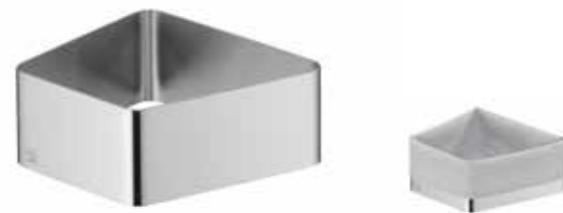
für alle Porzellanschalen S for all porcelain dishes S