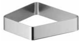
für Porzellanschale S 35 for porcelain dish S 35