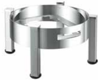
Füße 4-Kantprofil mattiert, Höhe inklusive Chafing Dish 37 cm satin finished feet profile 4-cornered, height inclusive Chafing Dish 14 1/2 inch