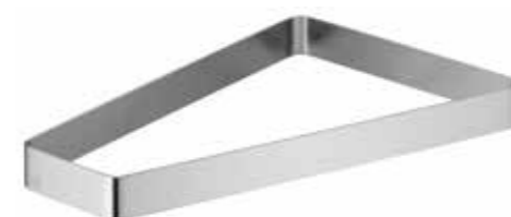
für Porzellanschale L 35, alle Platten L for porcelain dish L 35, all plates L