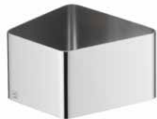
für alle Porzellanschalen S for all porcelain dishes S