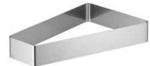
für alle Porzellanschalen L, Platten L for all porcelain dishes L, plates L