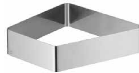
für alle Porzellanschalen M for all porcelain dishes M