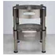
Füße Rundprofil, Höhe inklusive Chafing Dish 37 cm, stapelbar feet profile round, height inclusive Chafing Dish 14 1/2 inch, stackable