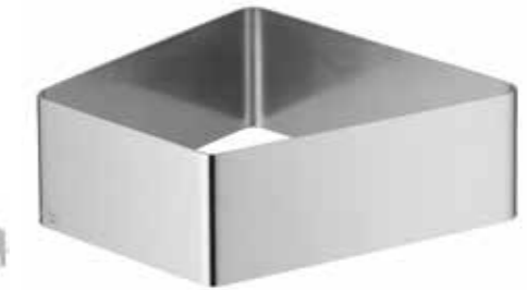
für alle Porzellanschalen M for all porcelain dishes M